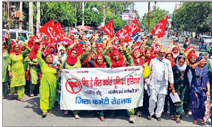
रोहतक। शनिवार को मांगों को लेकर प्रदर्शन करतीं और डीईईओ को ज्ञापन सौंपती मिड डे मील वर्कर्स।

26000 रुपये वेतन की मांग को लेकर किया प्रदर्शन और सौंपा ज्ञापन