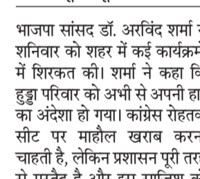
हरिभूमि न्यूज़ ▶▶ रोहतक

भाजपा सांसद डॉ. अरविंद शर्मा ने शनिवार को शहर में कई कार्यक्रमों में शिरकत की। शर्मा ने कहा कि हुड्डा परिवार को अभी से अपनी हार का अंदेशा हो गया। कांग्रेस रोहतक सीट पर माहौल खराब करना चाहती है, लेकिन प्रशासन पूरी तरह से मुस्तैद है और इस साजिश को कामयाब नहीं होने दिया जाएगा। सांसद ने कहा कि सबको पता है कि कांग्रेस शासन काल के गुंडागर्दी होती थी और जिसे भाजपा ने खत्म कर दिया। सांसद ने ग्रामीणों से कहा कि डरने की कोई जरूरत नहीं है, रात एक बजे भी फोन कर देना, उनका बेटा खड़ा मिलेगा। शर्मा ने कहा कि तीसरी बार भी देश व प्रदेश में भाजपा की सरकार