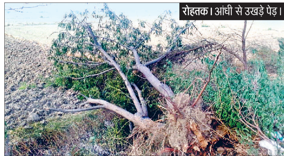
रोहतक। आंधी से उखड़े पेड़।

हरिभूमि न्यूज रोहतक/सांपला जिले में शुक्रवार देर रात आए तूफान ने भारी तबाही मचाई। कई जगह बिजली के पोल, ट्रांसफार्मर, शेड टूट गए। इसके अलावा भारी भरकम पेड़ भी धमाकों के साथ उखड़कर जमीन पर गिर गए। कई जगह लोगों को हल्की चोटें आई हैं। इसके अलावा गाड़ियां भी क्षतिग्रस्त हुई हैं। कई क्षेत्रों में बिजली बाधित रहने से लोगों को परेशानियों का सामना करना पड़ा। पेड़ और पोल गिरने की वजह से रास्ते बंद हो गए यातायात प्रभावित रहा। दिनभर बिजली निगम व वन विभाग की टीम राहत कार्य में जुटी रही। शनिवार की देर शाम बिजली चालू हो पाई।